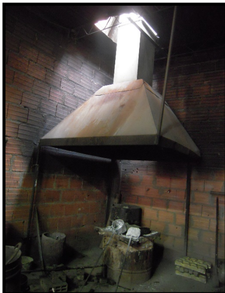
Fotografía del horno tipo crisol que funcionaba con aceite usado no tratado en las instalaciones del establecimiento comercial

De esta manera, con la conducta anteriormente descrita se vulneró la normativa ambiental en materia de emisiones atmosféricas del distrito capital, específicamente la siguiente disposición: